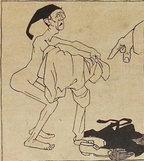
und das Hemd!

Michel, enlève ta veste ! Ton pantalon, s'il-te-plaît !