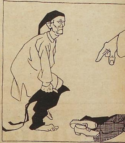
Nun, bitte, die Hose —