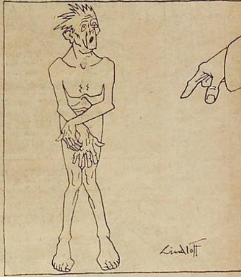
So, und jetzt entleere deine — Taschen!“

Et ton chapeau. Et maintenant, vide tes poches.